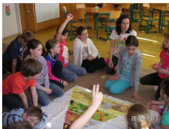
Zdravá pětka – pyramida správné výživy